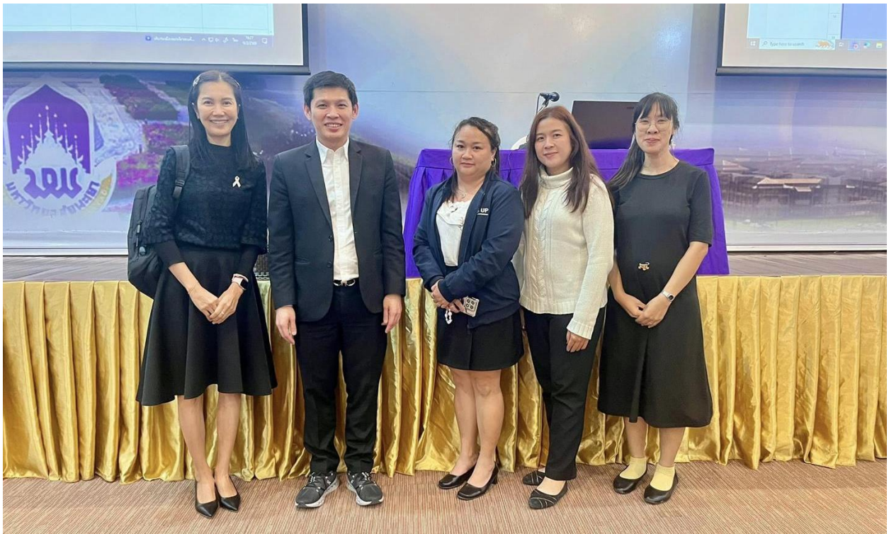
รายละเอียดเพิ่มเติม www.eng.up.ac.th/new/1351